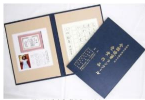
ア ル バ ム サ イ ズ 約 2 5 c m × 2 0 c m

記 念 特 製 ア ル バ ム を 多 く の 人 に 見 て い た だ く 「 展 示 ・ 鑑 賞 」 も 目 的 の ひ と つ で す。