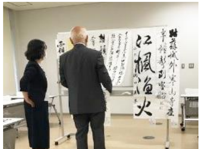
作品の向かって右が大賞、 その左が中国大使館文化部賞

全体的に、書写書道に対する真面目な取り組みを感じられる作品が多く、奇をてらわれない表現に好感が持てました。作品に正面から真摯に取り組むことはとても大切です。このような学びをぜひ続けてください。