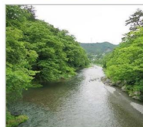
↑青梅市沢井 「楓橋」下の風景