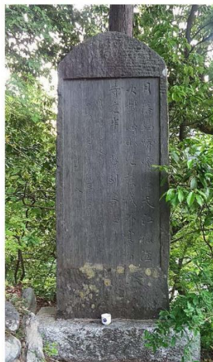
↑大日本寒山寺にある「楓橋夜泊」の石碑

14. 作品提出先 〒164-0001 東京都中野区中野 2-11-6 丸由ビル 3 階、書文協本部 電話 03-6304-8212 FAX 03-6304-8213 書文協ホームページ https://www.syobunkyo.org